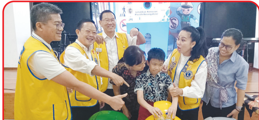
Seorang siswa dan orangtuanya mempragakan buang sampah pada tempatnya.

Ada pun kegiatan ini merupakan salah satu dari 5 aktivitas utama yang dicanangkan oleh Lions Club International. • kris