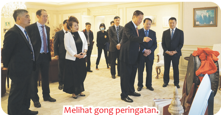
Melihat gong peringatan.