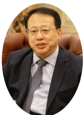
Wali Kota Gong Zheng.

Teguh Ganda Widjaja memenangkan penghargaan tahun lalu, hal ini merupakan pengakuan penuh atas kontribusinya yang luar biasa terhadap interaksi pembangunan ekonomi, budaya dan sosial antara Shanghai dan Indonesia