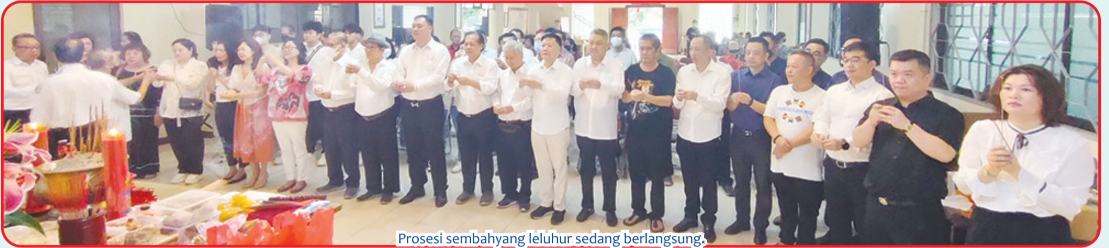
Prosesi sembahyang leluhur sedang berlangsung.