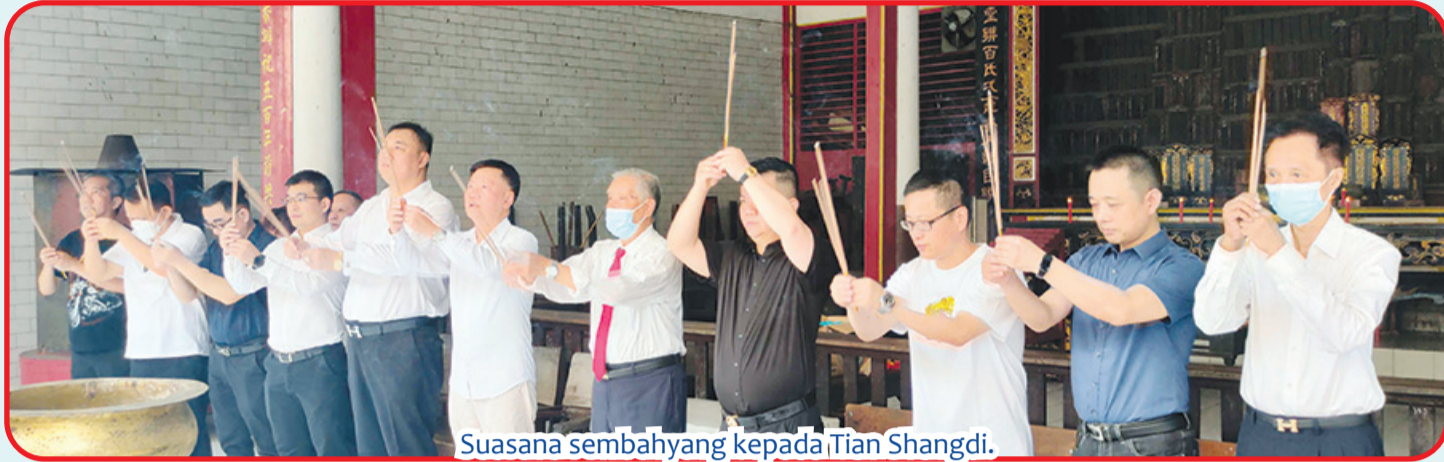
Suasana sembahyang kepada Tian Shangdi.