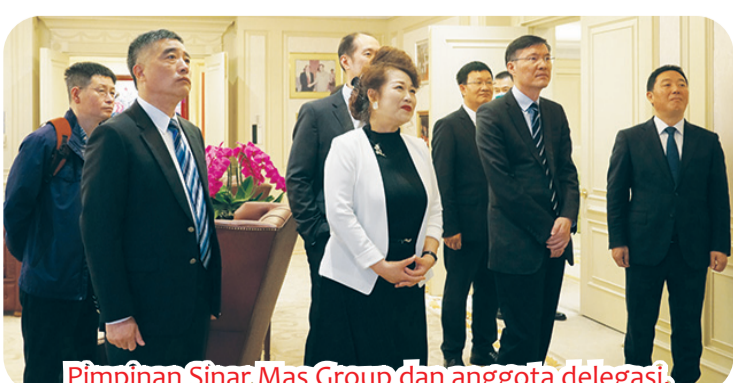
Pimpinan Sinar Mas Group dan anggota delegasi.