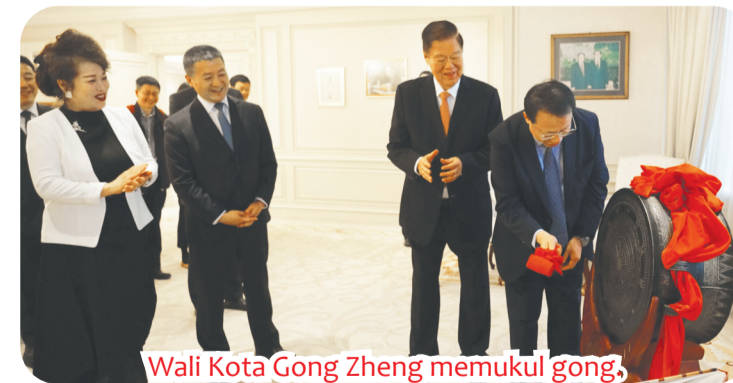
Wali Kota Gong Zheng memukul gong.