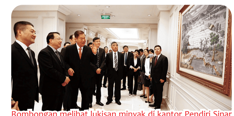
Rombongan melihat lukisan minyak di kantor, Pendiri Sinar Mas Group Huang Yi Cong.